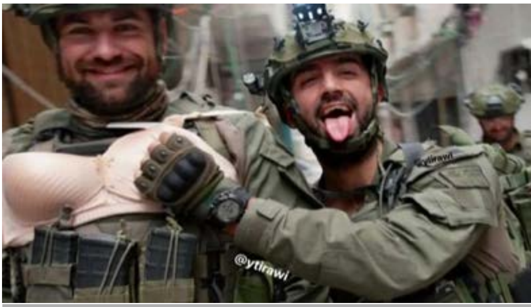
Soldados israelíes se burlan de sus víctimas

"Lo que Israel está haciendo ahora mismo es lo peor, no solo para los palestinos, sino también para los israelíes y los judíos. Será una mancha horrible para siempre", agrega.