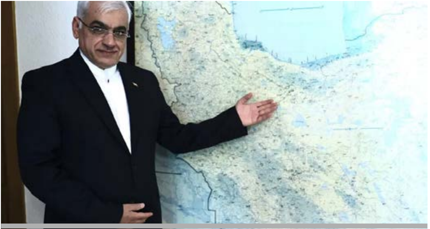
El embajador Reza Zabib

La entrevista entera puede verse en: https://www.20minutos.es/internacional/entrevista-embajador-iran-reza-zabib-solo-misiles-antiguos-usado-mas-avanzados-5725265/