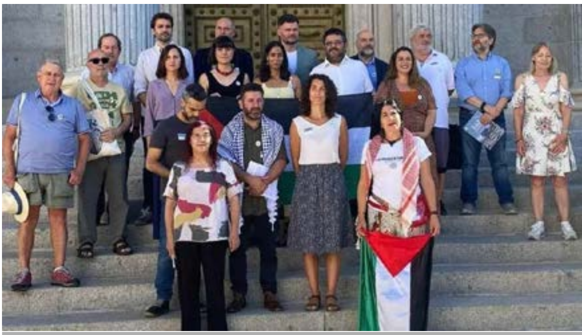
BNG, Sumar, Podemos, ERC e Bildu registran una iniciativa para regular el embargo de armas a Israel

Eso significa también mantener una permanente crítica a las posturas ideológicas convergentes con neoliberalismo, que infectan a gran parte de partidos y organizaciones de izquierda. Pero ello no tiene por qué bloquear las unidades de acción en cada momento concreto, siguiendo el criterio de unir todo lo unible contra el enemigo principal , siempre y cuando se den pasos para despejar el camino al socialismo, sirva para educar a las masas en la importancia de la movilización o favorezca la acumulación de fuerzas. Eso significa que los marxistas revolucionarios deben marcarse unos objetivos en cada acción y procurar ejercer la hegemonía política e ideológica (que no el control) de todo frente unido en cada movimiento o propuesta política; cosa imposible si no se moviliza a las masas, no se mantiene una posición política e ideológica independiente de las clases y sectores intermedios y vacilantes, o bien, se silencia la crítica para mantener la unidad. La Unidad con los partidos y sectores sociales intermedios, difícilmente se consigue en base a razonamientos, solamente se logra cuando las circunstancias obligan a ello.