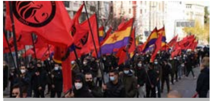
Manifestación Frente Obrero

están surgiendo animados por el avance del partido Alianza Sagra Wagenknecht-Por la Razón y la Justicia en Alemania, son perfectos candidatos para militar en la ultraderecha; algunos ya con escenografía y propuestas que recuerdan el fascismo de Mussolini en sus primeros tiempos, como el Frente Obrero . Este contexto general se manifiesta en España con sus pro-