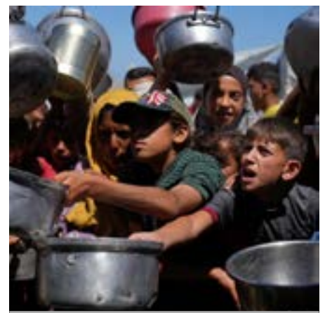
Luchan por sobrevivir, pero falta ayuda

los servicios secretos de Israel con el fin de tener una coartada con la que justificar la eliminación de los palestinos. Eliminación que se extiende también a Cisjordania. Y finalmente hay que señalar que Israel es un Estado cumple perfectamente el papel de guardian de los intereses imperialistas en aquella zona. Haga lo que haga siempre cuenta con el apoyo de Estados Unidos, y con las potencias capitalistas europeas. ■