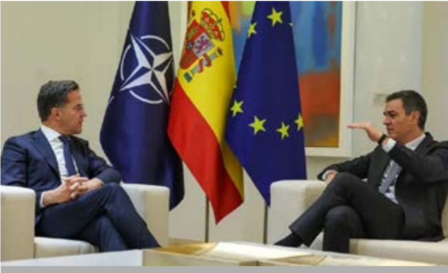
Sánchez afirma ante la OTAN su compromiso de llegar al 2 % en defensa

parte, es la practica normalizada de las grandes empresas que componen y no componen el IBEX-35 (a las que sirve el PSOE), es posible que todo quede en inicuos disparos de salvas.