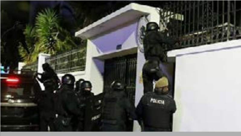
Asalto a la embajada de Mexico

cos, no tiene una explicación creíble, dentro del contexto del derecho internacional, aunque este sea interpretado según los sujetos de derecho.