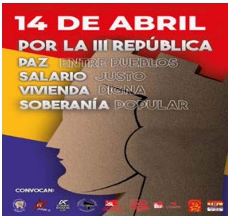
Ilustración: Fernando Francisco Serrano.

Layla Khaled 5 Centralismo democrático 7 Noticias de Palestina 9 Puigdemont y Ferrando 10 Sobre el capital del siglo XXI 11 Guerra de Ucrania 14 Minga y Domingas 15 El derecho internacional en entredicho 19