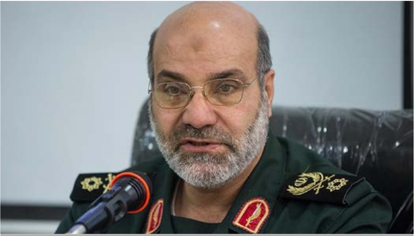
General Mohammad Reza Zahedi

En este contexto belicista del ojo por ojo Irán está en su derecho de atacar a Israel y declararle la guerra o mover a sus peones a través de las fuerzas de Hezbo-llah, Houthies y Hasd as-Shaab en el tablero bélico de hostilidades.