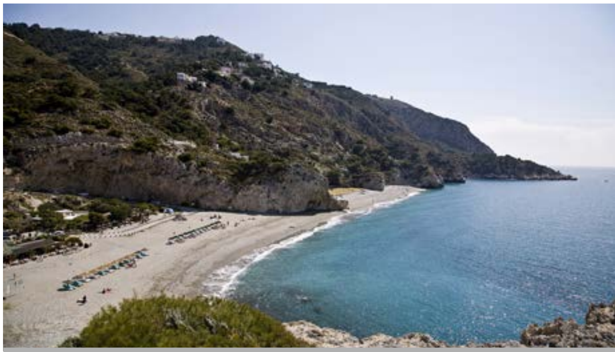
Playa nudista de Cantarriján - Almuñecar (granada)

dio de frente con las tetorras más succulentas que había visto en su vida. Disculpen el roce, no las había visto a ustedes, se apresuró a decir Minga claramente ruborizada y formalita. No te preocupes,