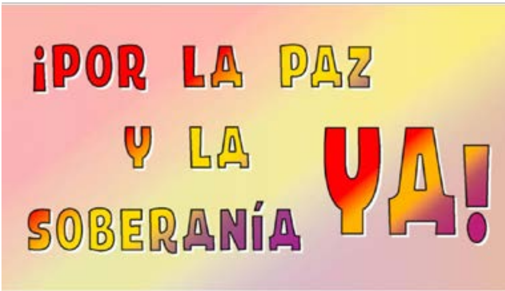
Ilustración: Fernando Francisco Serrano.

MANIFIESTO PARA LA PROMOCIÓN DE UNA CANDIDATURA ELECTORAL “¡POR LA PAZ Y LA SOBERANÍA YA!” A LAS PRÓXIMAS ELECCIONES AL PARLAMENTO EUROPEO.