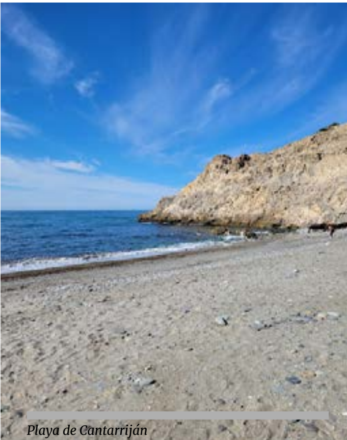
Playa de Cantarriján

medad que corroe la piel de cualquier parte del cuerpo y luego varias y al final todas. Es desolador, añadieron exhaustas. Vaya, lo siento, es verdad que tan malo es lo mucho como lo poco y, por cierto, no os he preguntado el nombre ahora que caigo, aproveché para conocerlas mejor. Domingas, nosotras somos domingos, ¿y tú?... se atrevieron a preguntar también. Pues qué casualidad porque mi nombre es parecido, me llamo Minga y lo mismo hasta nos tocamos algo, ¿no?, dijo sorprendida. Va a ser que sí porque tu capullo tiene toda la cara de una prima hermana nuestra, ¿dónde has estado metida hasta ahora?, dijeron las dos Domingas entusiasmadas. Pues agobiada y a punto de asfixiarme he estado presa en una cárcel de trapo, pero eso se va a acabar porque a partir de ahora me voy a poner derecha y, liberada, pasaré más tiempo con vosotras en este paraíso. ¡Ay, qué bien, qué bien!... se alegraron ellas, pero con esa piel tan fina y sonrosada... Me pondré chubasquero a diario si hace falta pero mejor eso que no toda la vida presa y ciega, e incluso os podré abastecer de chubasqueros a vosotras que os resguardarán del exceso de sol, respondió Minga toda resolutiva. Y así fue como, sin más preámbulo, Minga y Domingas se hicieron amigas inseparables y se quedaron a vivir juntas y felices para siempre en Cantarriján, el paraíso de las churras y las tetorras libres.