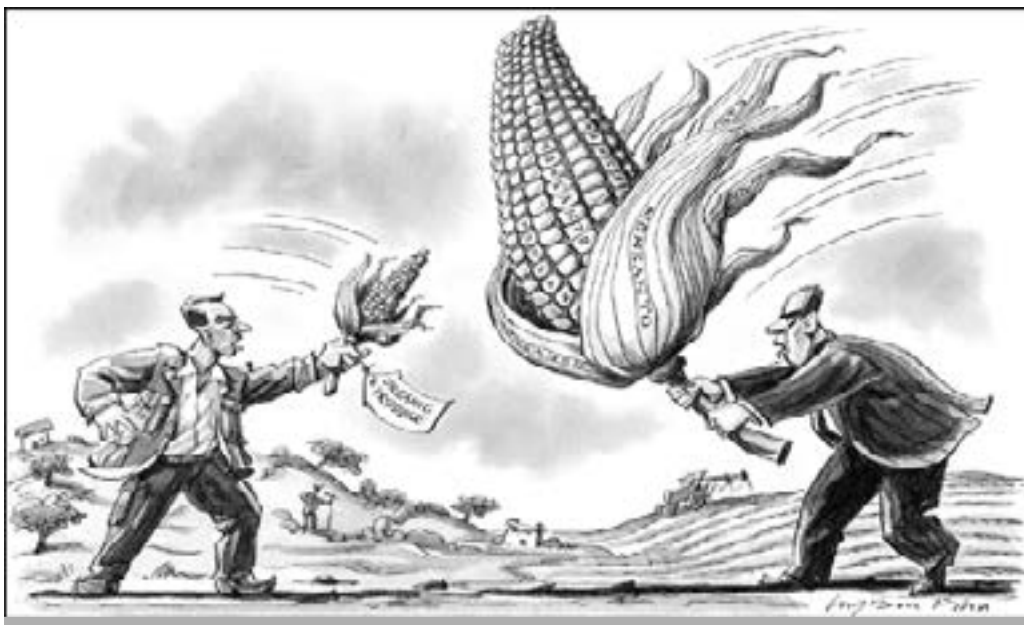
Monsanto, monopolio de las semillas.

Todos los productos que consumimos y se emplean en la industria proceden de la producción agrícola, ganadera, pesquera, minera y forestal, cuyo precio tendería a bajar a medida que aumentan las unidades producidas, si no fuera porque un puñado de multinacionales controlan la producción, el comercio y distribución. Cuatro de ellas dominan el 70% del comercio internacional de cereales, semillas y fertilizantes, condicionando los precios de todos los productos alimenticios destinados a consumo humano o animal. Estas son: Archer Daniels Midland (EEUU), Bunge, (Holanda), Cargill (EEUU) y Louis Dreyfus, (Países Bajos) . Estas empresas Tienen sus propias redes de distribución, transporte y almacenamiento en numerosos países del mundo; son propietarias o arrendatarias de tierras; controlan los mercados financieros de derivados agrícolas; practican la compra de cosechas y cultivos antes de la siembra. El mercado de la soja, el trigo o maíz también caen bajo su control y participan activamente en la producción ganadera y avícola.