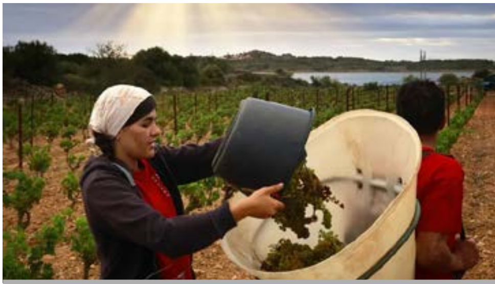
Vendimiando en Francia

La importancia sector primario tiene una proyección directa en la industria y en el comercio. Por ejemplo: el mercado minorista de productos alimentario europeo también está totalmente dominado por empresas alemanas y francesas. Las compañías alemanas Lidl, Aldi, y Edeka, junto con las francesas Carrefour, E, Leclerc, y les Mosquetaire, se reparten el mercado europeo de la distribución, muy atrás queda la espa-