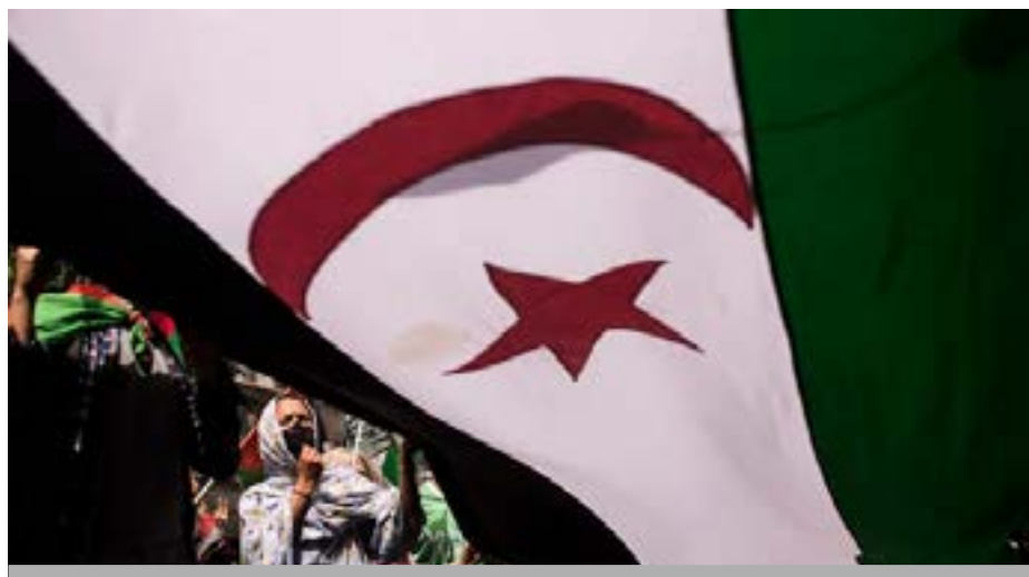
Bandera de la RASD

Al finalizar 1982, la república saharauí tenía una asignatura pen-