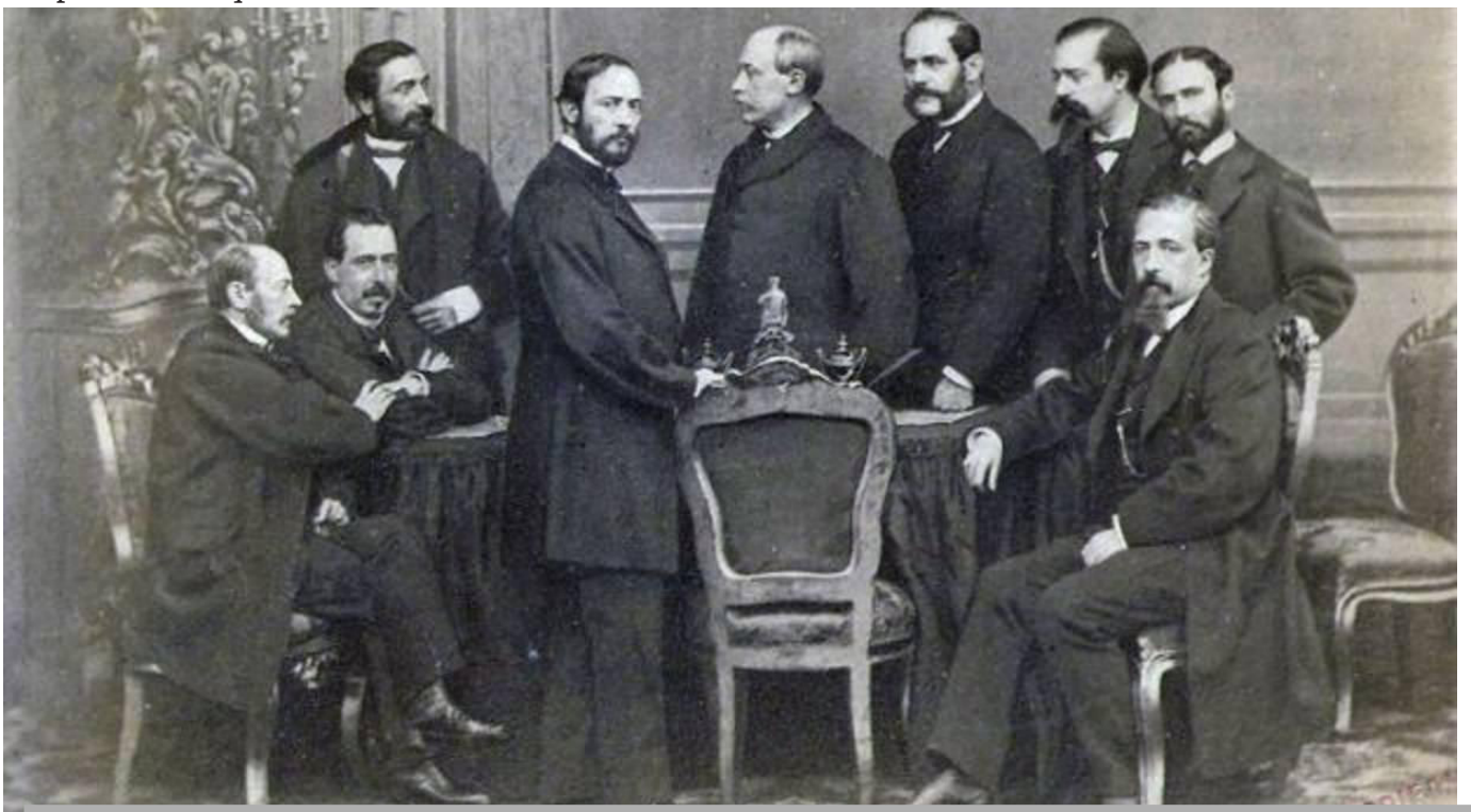
El ministro de Hacienda catalán Laureano Figuerola (primero por la izquierda) creó la peseta

Como el nacionalismo periférico es un tipo especial de ideología pequeña burguesa unida en un revuelto con alta burguesía, es propensa a canalizar el descontento social en una dirección imaginaria. La dirección política pequeña burguesa tiene tendencia a abandonar el barco a la primera oportunidad que se presenta para llegar a un acuerdo con las elites dominantes. Y eso es lo que ha ocurrido con el acuerdo de los partidos nacionalistas con el PSOE para formar gobierno. Y que objetivamente pueden convertirse -a pesar de su declarado republicanismo- en un soporte de la monarquía oligárquica. En ese caso, en lugar de potenciales aliados pasarían a ser enemigos a abatir, y denunciarlos por capitanes araña. Todavía es pronto para ver si esa pequeña burguesía nacionalista se pasa definitivamente al campo de la reacción monárquica, pero todo apunta en esa dirección. Dentro de poco lo sabremos, pues con la pequeña ya e sabe "ni es carne ni pescado".