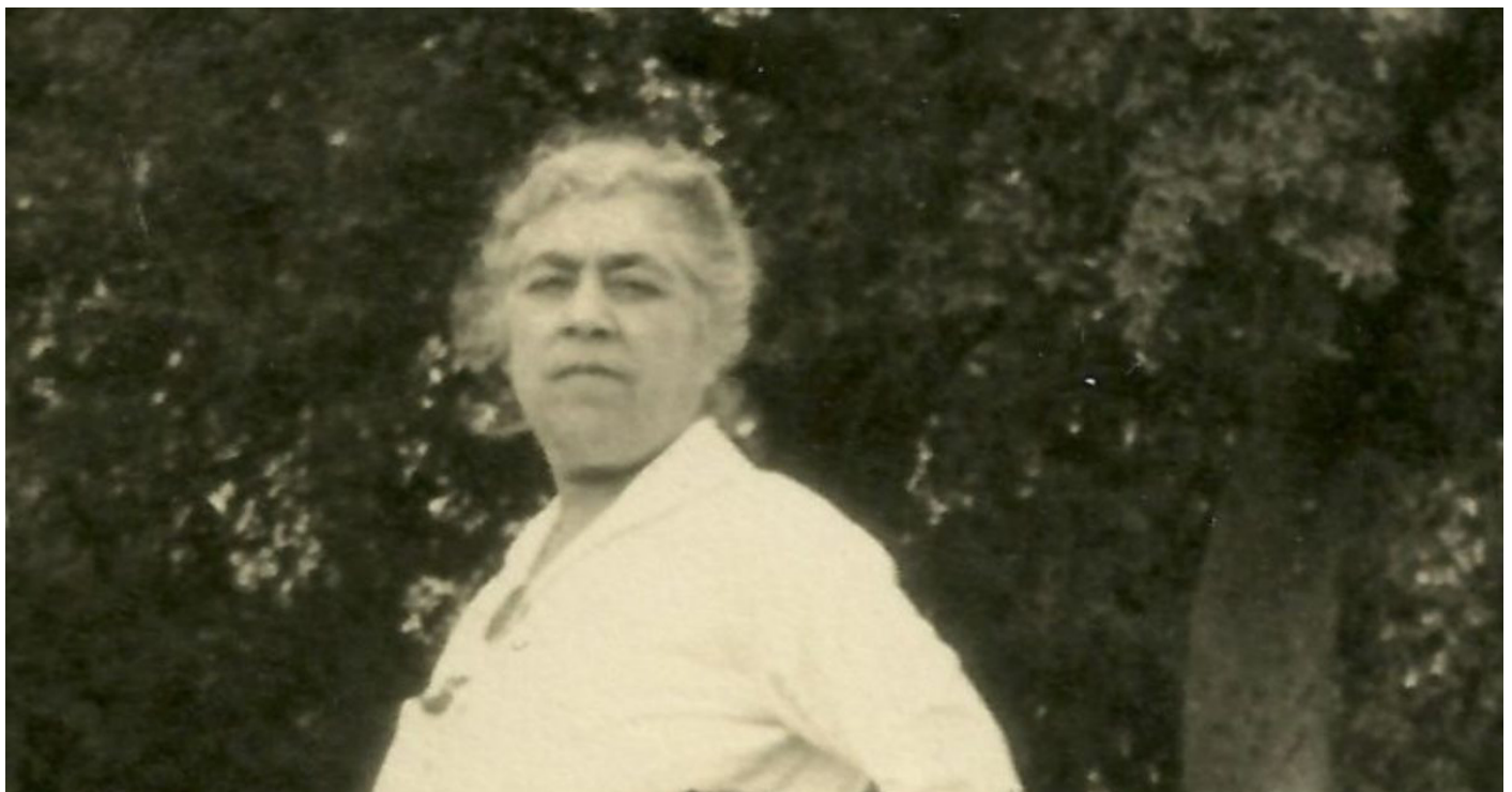
Catalina Albert, más conocida como V́ctor Català