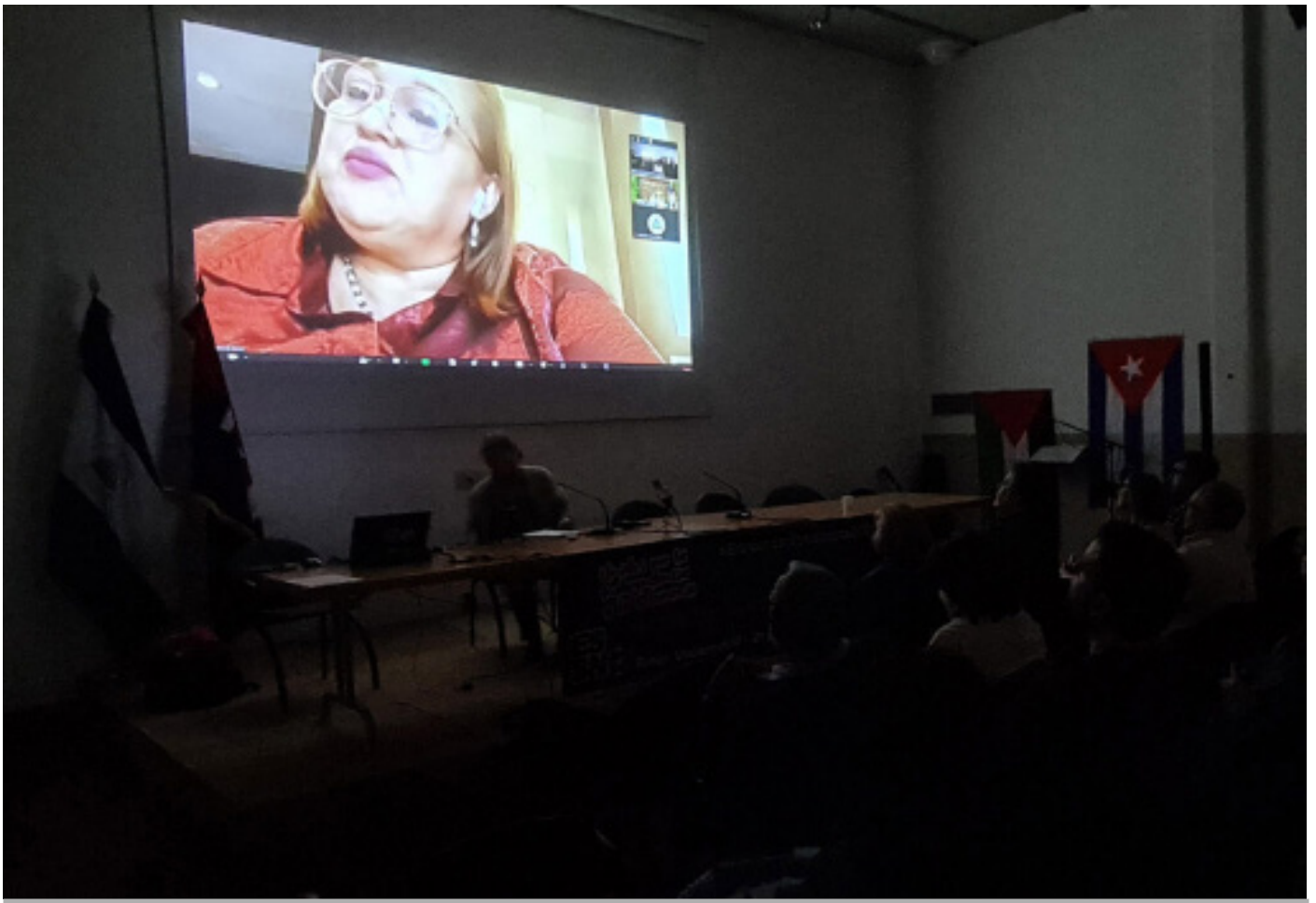
Brenda Rocha, presidenta del consejo supremo electoral de Nicaragua