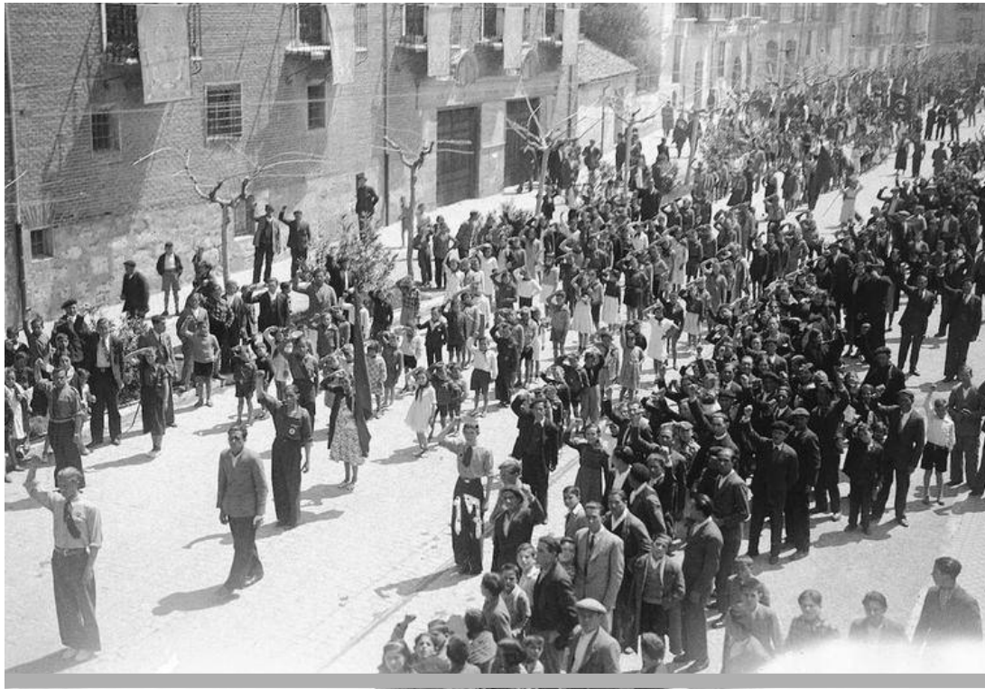
Celebración del Primero de Mayo en Valladolid en 1936.

político. Asambleas Republicanas como sujeto de acción de tipo permanente de partidos y de organizaciones de la sociedad civil, tanto a la hora de las demandas, como de la presentación de candidaturas electorales de confrontación directa con los poderes de la monarquía y su Constitución, planteándonos que las Asambleas Republicanas deberían promover candidaturas a las próximas elecciones europeas de junio de 2024.