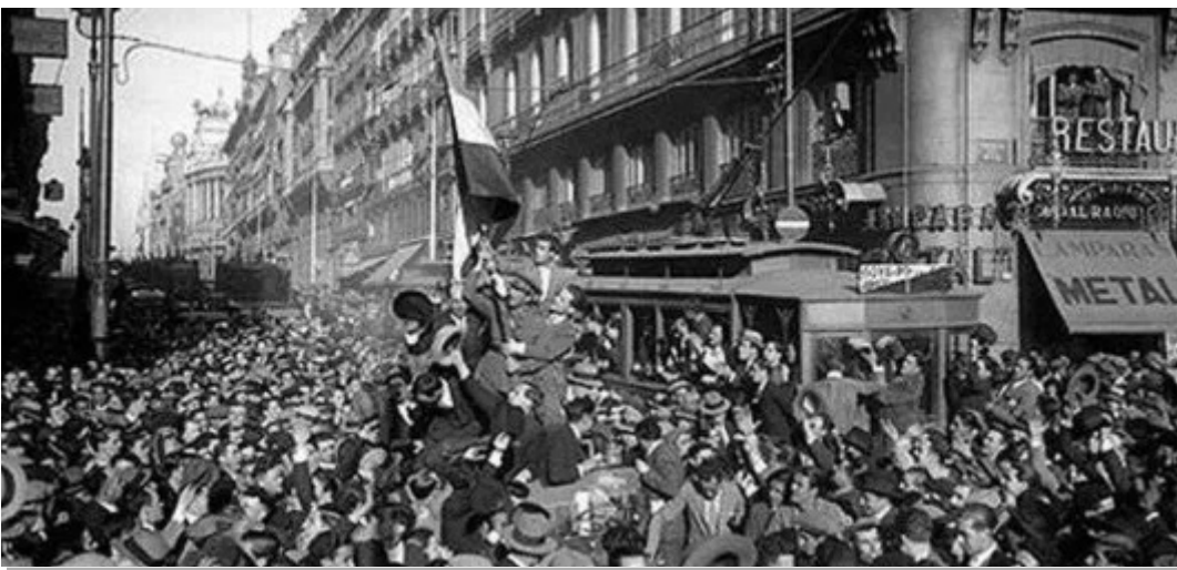
Proclamación de la II República

E l 27 de octubre el Salto diario, publico un artículo bajo el título “La gran manifestación por la República de esta década ya tiene fecha en el calendario”. En dicho artículo se decía que en junio del año 2024 se cumplen 10 años de la coronación de Felipe VI, y recordaba que el 2 de junio de 2014, el mismo día que se anunciaba la abdicación de Juan Carlos I, se producían grandes manifestaciones en las principales ciudades pidiendo la República y el fin de la monarquía. Claro está, esta abdicación no se produjo porque el rey cazara elefantes en compañía de su amante. Hechos como ese, e incluso más escandalosos se habían producido anteriormente. Lo que ocurre es que, aunque eran conocidos, e incluso algunos publicados en el libro “Un rey golpe a golpe” (editada por una librería vasca cerrada por orden del juez Baltasar Garzón), había un consenso de silencio tácito entre los poderes facticos y los medios de comunicación sobre la corrupción de la casa real, y a fin de reforzar la monarquía presentando a Juan Carlos I como un campeón en todo aquello con lo que se relacionaba. Antes de su abdicación la prensa lo presentaba como un ser extraordinario; más o menos como ahora a su hijo Felipe VI, y a su nieta y heredera Leonor. Fue neces-