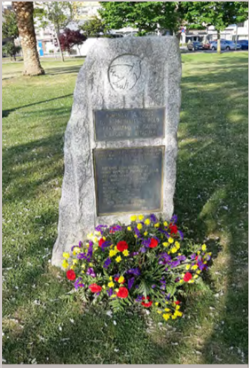
Sada (A Coruña)

En varios lugares de la geografía española nuestros camaradas del Partido del Trabajo de España estuvieron presentes en los actos conmemorativos y reivindicativos del 14 de abril, día de la República