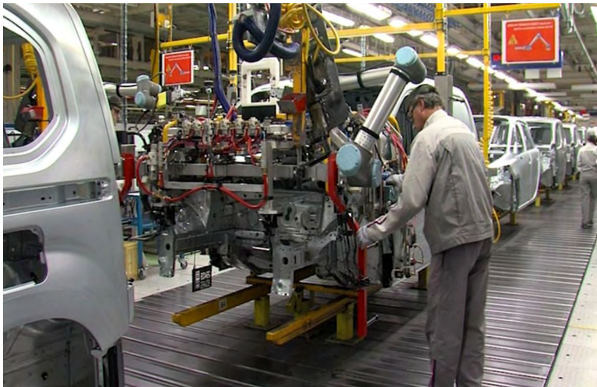
Factoría de Citroën en Vigo.